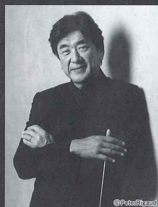
佐渡裕 (音楽監督・指揮) Yutaka Sado

京都市立芸術大学卒業。故レナード・バーンスタイン、小澤征爾らに師事。1989年ブザンソン指揮者コンクール優勝。現在、パリ管弦楽団、ケルン WDR 交響楽団、ベルリン・フィルハーモニー管弦楽団、北ドイツ放送交響楽団等、欧州の一流オーケストラに毎年多数客演を重ねている。2015年9月よりオーストリアのトーンキュンストラ管弦楽団音楽